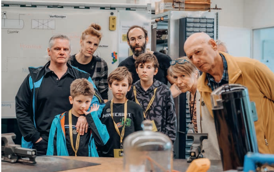
Spannende Einblicke bei der Langen Nacht der Forschung.

Ein Highlight war die sogenannte "Wetter-Zauberammer", in der die Funktionalität der Wärmepumpen unter extremen Wetterbedingungen demonstriert wurde. iDM dankt allen Besuchern für das große Interesse.