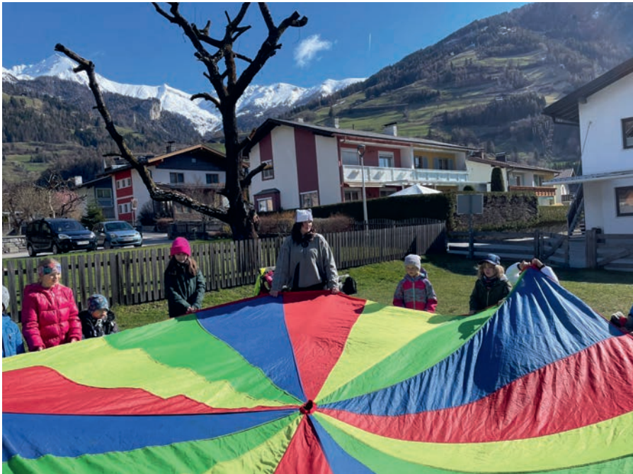
Abwechslungsreiches Programm bei der Kinderbetreuung.

Die Aktivitäten, wie Wanderungen, Spiele und kreative Workshops, fanden überwiegend im Freien statt und sorgten für viel Spaß und Bewegung.