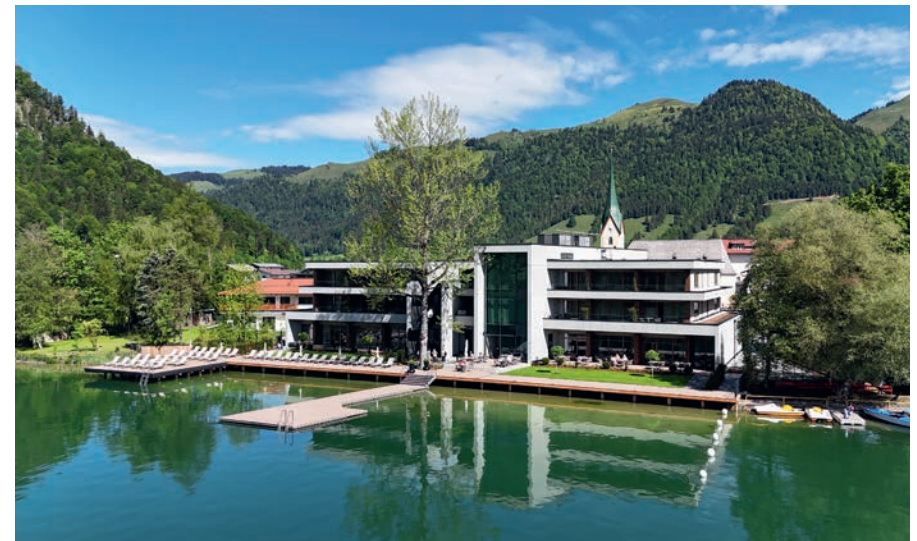
Das neue Lakeside lädt direkt am See zum Verweilen ein.

Zusätzlich verfügt das Lakeside über moderne Seminarräume mit Ausblick auf den Walchsee. Die Räume sind bestens ausgestattet und eignen sich hervorragend für Seminare, Tagungen und Teambuilding Events.