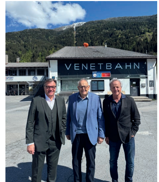
Alt-LH Günther Platter, KR Anton Pletzer und Friedl Eberl.

Geplant sind umfassende Modernisierungen und Investitionen, darunter die Möglichkeit eines Neubaus der Pendelbahn. Der Winterbetrieb 2024/2025 wird wie zugesichert wieder aufgenommen.